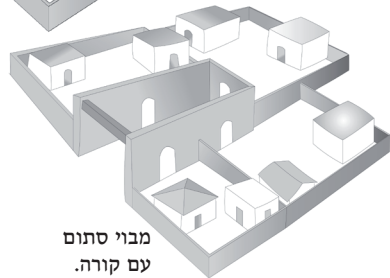
מבוי סתום עם קורה.