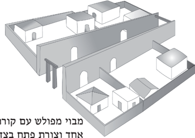
מבוי מפולש עם קורה בצד אחד וצורת פתח בצד שני.