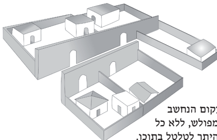
מבוי עקום הנחשב כמפולש, ללא כל היתר לטלטל בתוכו.