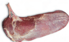
7.6 טחול של פרה עם הקרום שעליו. ניתן לראות את צורת הלשון (מאכ"א ז, יא; שחיטה ו, ט).