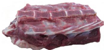
7.8 עצם המותן (הסיניטה) ובשר הסיניטה מתחתיו כשהוא מנוקר (מאכ"א ז, ח).