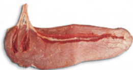
7.7 טחול של פרה לאחר הסרת הקרום וחשיפת החוטים.