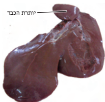
7.5 כבד כבש מנוקר ויותרת הכבד (מאכ"א ז, ה).