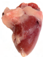
7.2 לב של עוף.