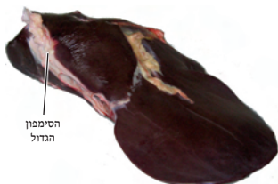
7.4 כבד של עגל עם החלב והקנה שעליו (שחיטה ו, ח).