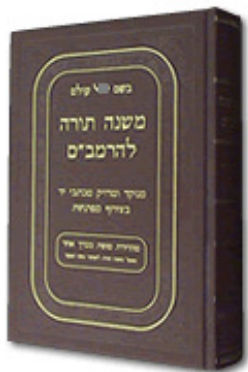
'משנה תורה' בכרך אחד