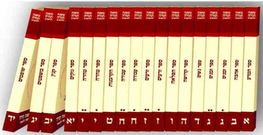
ביאור תמציתי אך מקיף. מהדורת הכיס

אין ספק שהסדרה המבוארת (שכעת הודפסה בפורמט כיס ומתוכננת לצאת גם בפורמט גדול יותר) של משנה תורה צועדת צעד נוסף וחשוב לקראת המטרה של הנחלת ספר משנה תורה (על כל 1000 פרקיו) לציבור הרחב. בשנים האחרונות, בזכות מפעל ה"דף היומי", יש יותר ויותר "בעלי בתים" שזכו לסיים