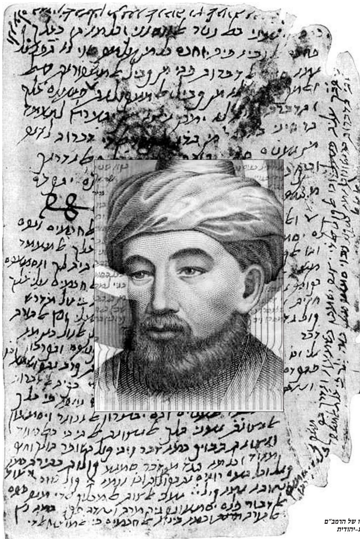
כתב ידו של הרמב"ם בערבית-יהודית

"בשבילי, הרמב"ם בהלכות מלכים זה אחד הרברים המדהימים", אומר מקבילי. "הוא כותב את זה תחת שלטון מוסלמי לפני 800-850 שנה. הוא רואה מול עיניו חייל ומודריך אותו. 'מאחר שייכנס אדם בקשרי המלחמה, ישען על מקווה ישראל ומושיעו בעת צרה וידע שעל איחוד השם הוא עושה מלחמה,