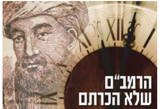
מאת: הלל גרשוני