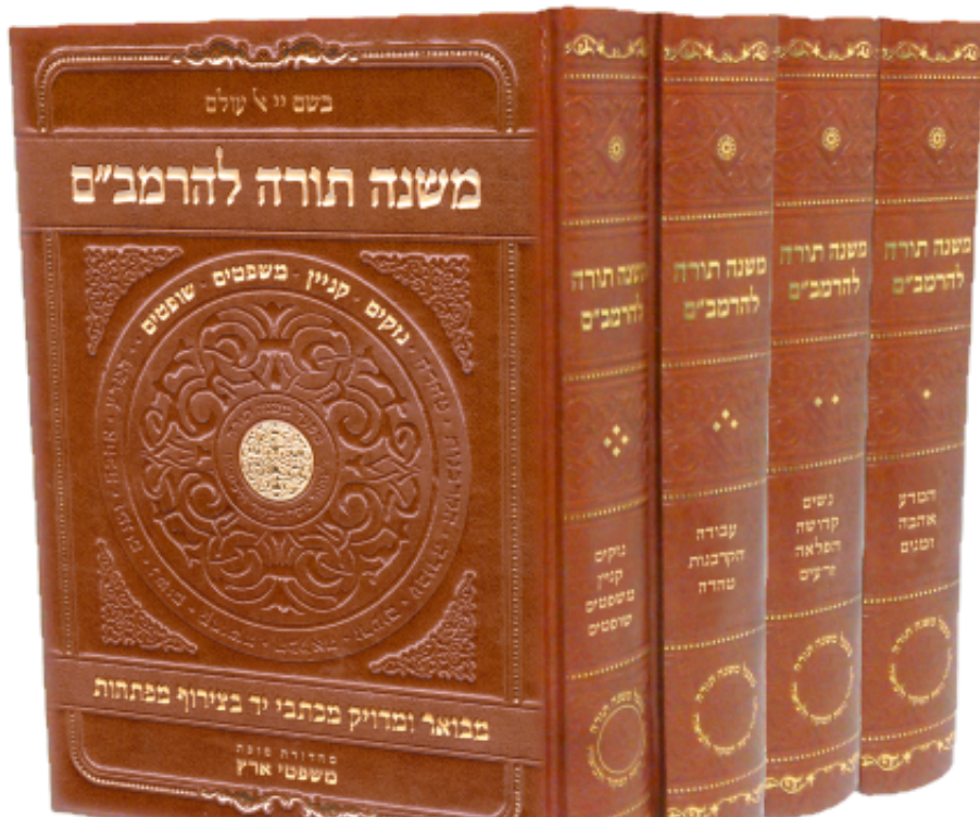
ספרי מפעל משנה תורה עם הביאור הייחודי

לצד אלו, הושקע גם מאמץ בהגשה הגרפית של החומר, צירוף כותרות משנה, תמונות צבעוניות שמבארות הלכות מורכבות ותוספות רבות נוספות. "זו היתה מלאכה סיזיפית מאוד מאוד גדולה וקשה, אבל היה שווה להגיע בסוף למטרה - להנגיש לכל אדם, גם ליהודי שמעולם לא פתח ספר תורני, את התורה באמצעות הרמב"ם. כמובן שבאותה נשימה, גם תלמידי חכמים ימצאו בחיבור הזה הרבה 'פנינים' ויבינו לעומק את מה שבאמת הרמב"ם כותב".