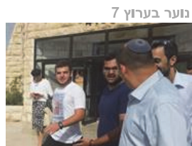
נוער בערוץ 7