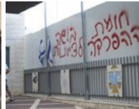
צו סגירה לכיתות המריבה