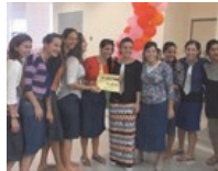
לאחר 9 שנים: משכן קבע לאולפנת נווה דקלים