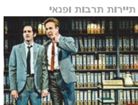
תיירות תרבות ופנאי