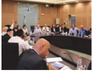
הכי מדובר פרוכוקציה בוועדת הכספים מדיניות ופוליטיקה