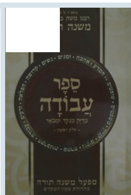
מפעל משנה תורה הרמב"ם מפעל משנה תורה, ישיבת אור וישועה ומכון המקדש

ישי קרוב, פרסום ראשון: י' בסיון תשע"ג, 10:59 19/05/13