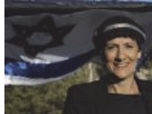
"המטרה היא הגדלת כוחה ומשמעותה של הצינונת הדתית"

הרמב"ם דיבר על כך שצריך לעסוק בכל מקצועות התורה, שאדם יוכל להכיר את תמצית התורה כולה בזמן סביר. זהו החיבור היחידי עד היום שעוסק בכל התורה כולה מתפילה ותפילין ועד בית מקדש וסנהדרין.