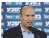
בנט מצהיר: "הבית היהודי הולך להנהגה"

אהבתי 12 אלף עושים לייק לסרוגים ונשארים מעודכנים!