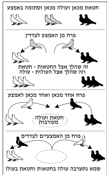
איור מבאר להלכה ז: חטאת מכאן ועולה מכאן וסתומה באמצע

ז, אֲלֹא יֹאמֵר וְכו' - כִּיּוּן שֶׁהֵקָן סְתוּמָה, וְגוֹזֵל אֶחָד מִמֶּנָּה נִתְעַרַב רַק בַּחֲטָאָה אוֹ רַק בְּעוֹלָה, יִכּוֹל לַקְּבֹעַ שְׁהוּא כְּמוּתָם. רֵאָה אִיּוֹר.