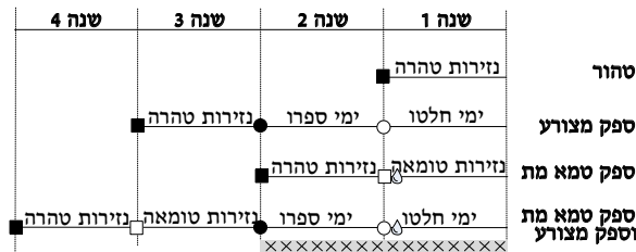
מקרא: ○ תגלחת ראשונה ותגלחת שנייה של מצרע □ תגלחת טומאה ותגלחת טהרה של נזיר ◊ טהרה מטומאת מת ×× מחוסר כפרה

ג שמא אינו מצרע אלא טמא מת ודאי היה – ואז השנה השנייה היא נזירות טהרה, שאינו מגלח בה על ספק צרעת.